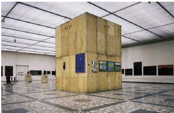
5 pav. Parodos „Tylusis modernizmas“ apipavidalinimas, 1997 m.

Tradicinės parodos suvokimas bendrąja prasme yra susijęs su dviejų dimensijų medijų naudojimu turiniui pažinti, su dažniausiai dokumentuojančiu, o ne tiriamojo pobūdžio objektų pristatymu ir chronologiniu naratyvu. Tenka pripažinti, jog tradicinė paroda Lietuvoje dažniausiai yra dokumentuojanti ir plokščia .