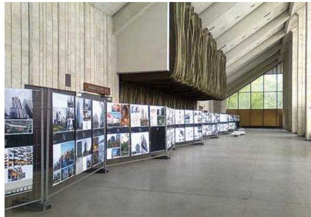
4 pav. Paroda „Vilniaus architektūra 2007–2008“ Vilniaus Koncertų ir sporto rūmuose

Šio parodos tipo pavyzdžiais Lietuvoje laikytinos etapinės „architektūros architektams“ parodos, tokios kaip „Žvilgsnis į save“, „Vilniaus architektūra“ (4 pav.), „Doleta“ ir pan., kurios iš dalies tarsi užpildo architektūrinės informacijos trūkumą, bet yra suprantamos ir įdomios gerai kontekstą išmanančiai, siaurai profesinei bendruomenei. Labai dažnai jos yra siejamos su geriausių darbų konkursais, kuriuose komisija, na-