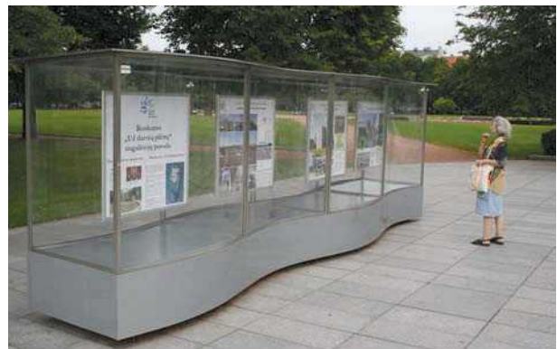
3 pav. Laikini parodiniai standai Lukiškių aikštės prieigose Vilniuje

Apibendrinančiosioms parodoms gali būti priskirti didesnio masto renginiai, į kuriuos įtraukiamas ne vienas kuratorius, dažnai kelių šalių architektai. Juose pristatomos pavienių architektų ar jų grupių praktikos, kurios gali būti siejamos panašios veiklos ideologijos, bendros kuratoriaus nustatytos temos. Šį tipą galima būtų iliustruoti Njujorko modernaus meno muziejuje MoMA 1932 m. vykusios parodos „Moderni architektūra: tarptautinis stilius“ ( Modern Architecture: