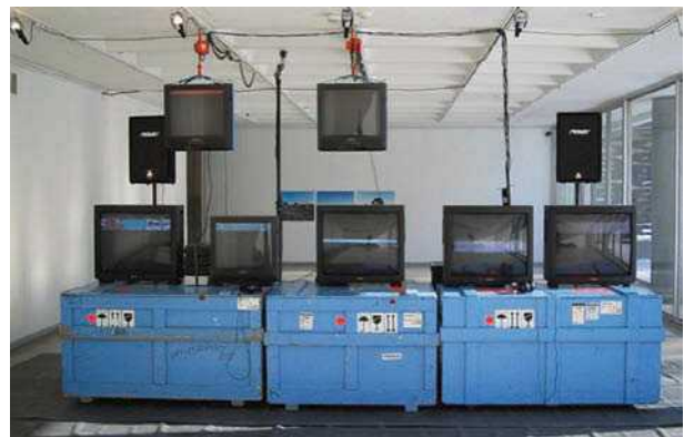
6 pav. Parodos „(Ne) lyderis“ fragmentas, 2004 m.