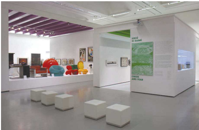
9 pav. Parodos „Šaltojo karo metų modernizmas. Menas ir dizainas: 1945–1970“ fragmentas, 2009 m.

Iš dalies architektūros laboratorija galima pavadinti ir kai kurias įvykusias šiuolaikinio meno parodas, kuriose sėkmingai bendradarbiavo menininkai bei architektai. Prie tokių skirtingas disciplinas jungiančių bei bendradarbiavimą tarp skirtingų sričių kūrėjų skatinančių projektų galima priskirti 2009 m. Šiuolaikinio meno centre pristatytas X Baltijos tarptautinio meno trienalės „Miesto istorijos“ parodas. Diskursyviai mieste vykstančius procesus, pokyčius bei pastebėjimus apie viešąsias erdves menininkų bei architektų akimis pristatė trienalės paroda Vilnius COOP (kuratorės Vera Lauf ir Ūla Tornau). Ilgą laiką miesto centre nenaudojama pastate eksponuojama paroda ne tik pasiūlė naują funkcinę panaudą buvusiai visuomeninei erdvei, bet