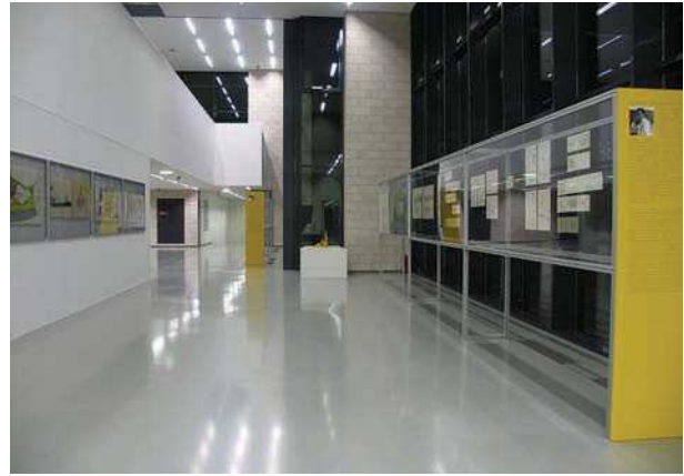
2 pav. Paroda „Našlaičiai“, NDG, 2010 m.

Lietuvos architektūros pristatymo kontekste tiriančiosios parodos pavyzdžiu iš dalies galima būtų laikyti Lietuvos architektų sąjungos įrengtus mobilius standus Lukiškių aikštės prieigose (3 pav.). Kaip ne itin įnoringa ir lanksti prezentacijos forma mobilūs standai tarp architektūros kuratorių yra palankiai vertinami dėl to, jog jais gali būti atkreipiamas už kultūros ar architektūros institucijų ribų esančių visuomenės narių dėmesys į erdvės formavimo klausimus. Naudojant mobilius standus pasiekama tokia auditorija, kuri galbūt niekad neateitų į institucijoje pristatomą parodą.