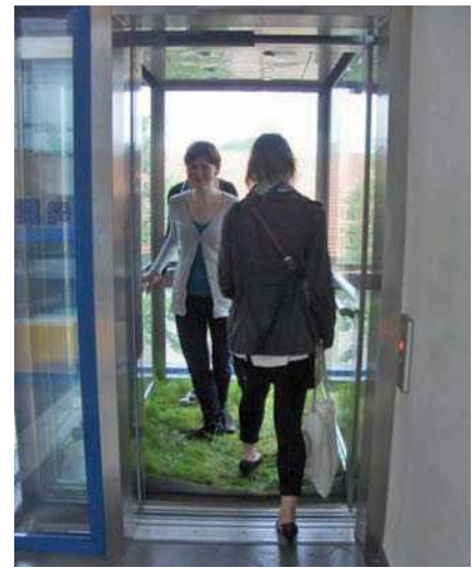
10 pav. A. Dovydavičiūtės instaliacija „Liftas“, 2010 m.