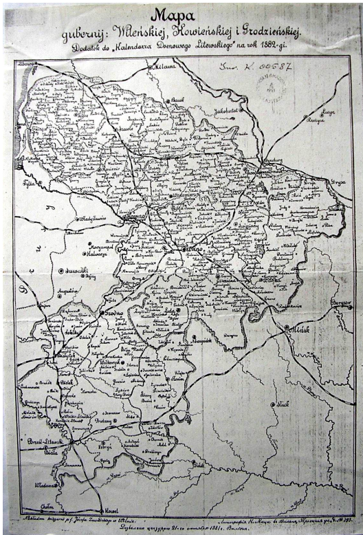
18 pav. 1882 m. Vilniaus gubernijos žemėlapis