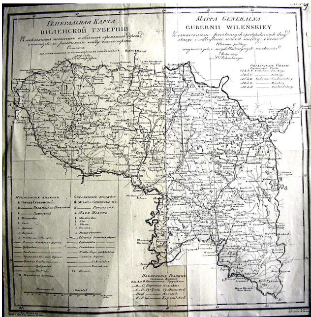
13 pav. Vilniaus gubernijos generalinis žemėlapis

Kariškiai buvo priversti daugiau rūpintis imperijos apsauga ir nebespėjo vykdyti civilinėms reikmėms reikalingų darbų, todėl prie Valstybės turtų ministerijos 1838 m. įsteigtas Civilių topografų korpusas. Civilių topografų korpuso nuostatus patvirtino pats caras 1838 m. kovo 7 d. (16 pav.). 1840 m. liepos 7 d. panaikinamas Lietuvos statuto galiojimas ir įvedami Lietuvoje Rusijos įstatymai. 1841 m. suaktyvėjo kitų Lietuvos bažnytinių žemių nusavinimas. 1843 m. įsteigta Vilniaus gubernijos turtų valdyba (uždaryta 1862 06 06). 1843 m. gegužės 17 d. Vilniuje buvo įsteigta Vilniaus Gardino, Minsko ir Kauno gubernijų centrinė dvarininkiškos kilmės reikalų revizijos komisija. Šiai komisijai šlėkta privalėjo pristatyti savo dvarininkiškos kilmės įrodymus. Daugelis neturėjo jokių dokumentų, kiti, nors ir turėjo, negalėjo apsimokėti neišvengiamų išlaidų, susijusių su „dvarininkiškų“ teisių paieškomis, todėl jų žemės ir turtas buvo nusavinti. 1844 m. balandžio 15 d. įkurtas Vilniaus gubernijos dvarininkų valdų inventorių patikrinimo ir sudarymo komitetas (uždarytas 1858 04 19).