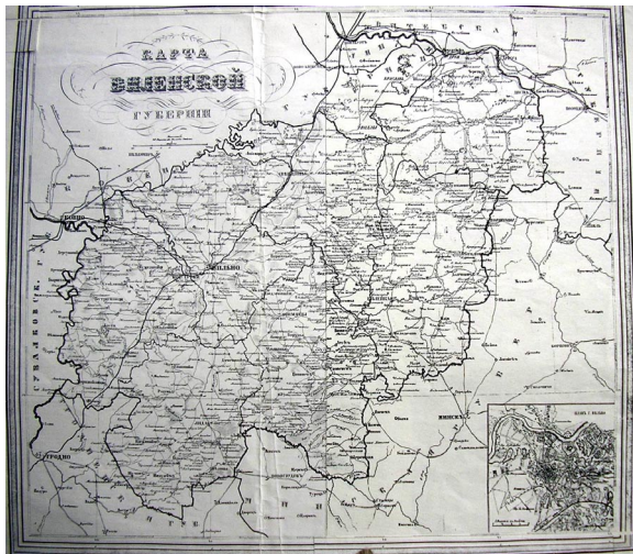
17 pav. 1871 m. Vilniaus gubernijos žemėlapis