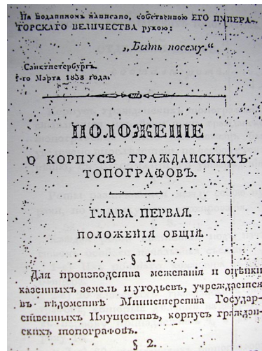
16 pav. Civilių topografų korpuso nuostatų fragmentas

Vidaus reikalų ministerijoje 1845 m. įsteigta Rusijos geografų draugija. Pramanytas naujas rusifikacijai parankus viso istorinio ir politinio regiono pavadinimas – Vakarų kraštas, arba tiesiog Vakarų Rusija. Atsirado ir šio termino vedinių regiono dalims pavadinti. Buvusioms LDK žemėms, XVIII a. pabaigoje tekusioms Rusijai, ilgainiui prigijo Šiaurės vakarų krašto pavadinimas. Rusifikacinės geografijos terminijos įvedimas buvo viena iš tos specifinės, tik šiam regionui taikomos, rusinimo politikos sudedamųjų dalių. Ši politika buvo grindžiama XIX a. ketvirtajame dešimtmetyje pradėta plėtoti politizuota istoriografinė koncepcija, esą LDK susikūrė ir plėtojosi rusų civilizacijoje iš esmės kaip viena iš rusų valstybių ir buvo net Maskvos konkurentė kovoje dėl rusų žemių suvienijimo. Vienas iš tokio teiginio argumentų – tai susigiminiavusios kai kurių Rusijos carų ir LDK kunigaikščių šeimos. 1850 m. Matininkų korpusas sukuriantas. Jis pradėjo veikti karinio dalinio principu.