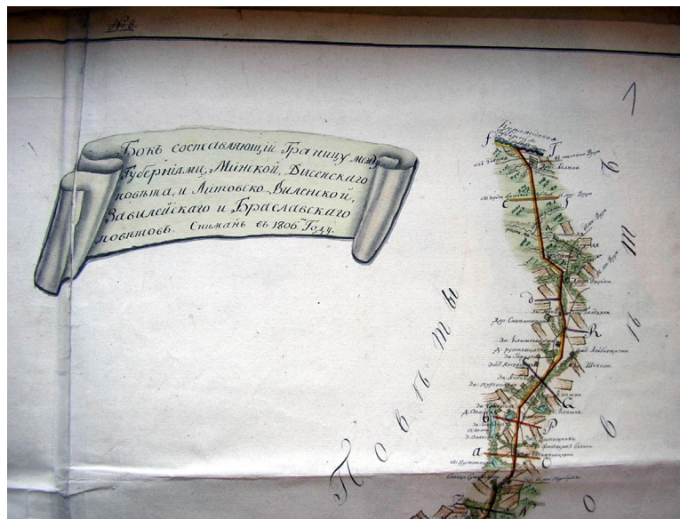
10 pav. Ribos tarp Vilniaus ir Minsko gubernijų planas; lapo Nr. 8 fragmentas

Baltarusijos gubernija buvo padalyta į Baltarusijos Vitebsko ir Baltarusijos Mogiliovo gubernijas, Baltarusijos Vitebsko gubernija išsikūrė vietoje buvusios Polocko „namiestničestvos“. Tarp Vilniaus ir Minsko gubernijų 1806 m. detalai nustatyta riba [13, 14] (10 pav.).