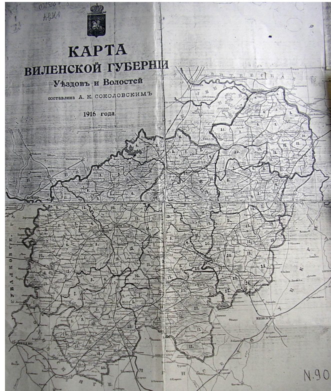
19 pav. 1916 m. Vilniaus gubernijos žemėlapis