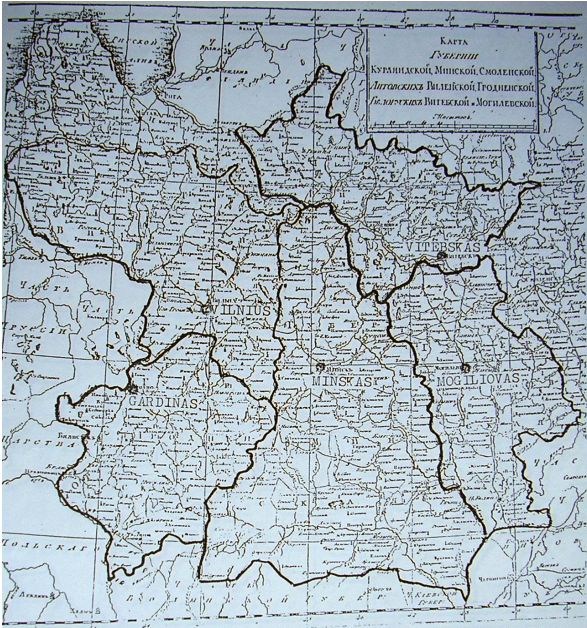
11 pav. Kai kurios Rusijos gubernijos