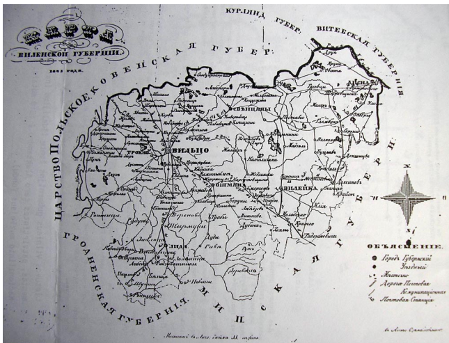
15 pav. Kauno gubernijos žemėlapis